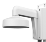
DS-1272ZJ-110B Настенный кронштейн