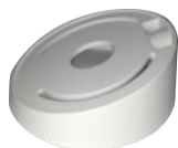
DS-1259ZJ Потолочное крепление