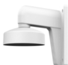
DS-1272ZJ-110 Настенный кронштейн